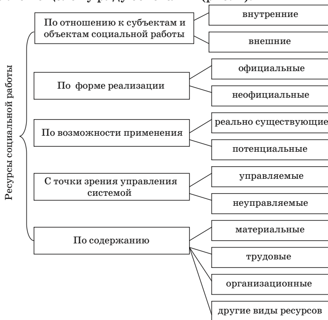
Рис. 1. Классификация ресурсов социальной работы

социальный работник принимает во внимание возможности общества, собственные профессиональные возможности и возможности самих клиентов социального учреждения. Анализируя имеющиеся в экономической литературе исследования, классифицировать ресурсы социальной работы можно по целому ряду оснований (рис. 1).